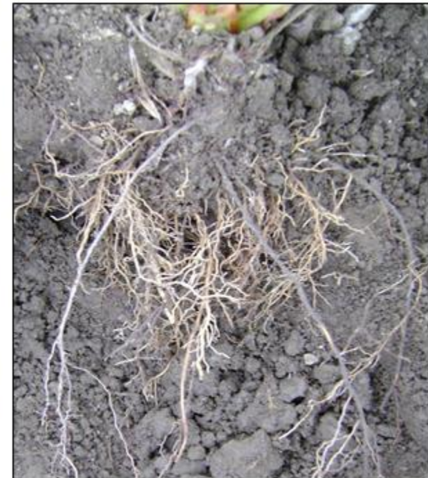
Rooting 1 L/Ha