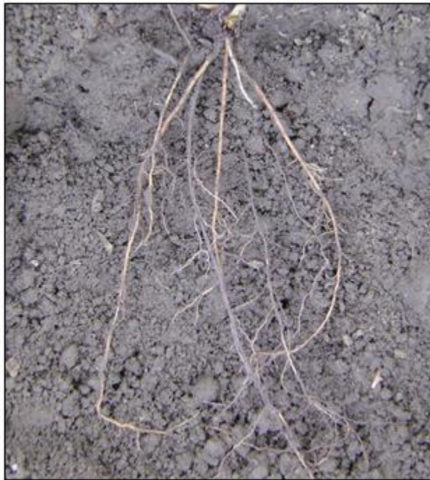
Testigo sin aplicación