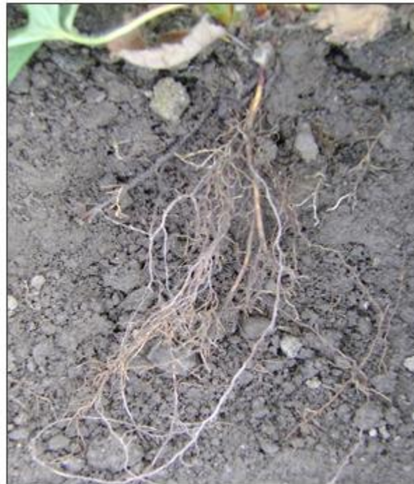
Testigo comercial 1 L/Ha